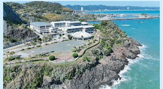
スタート・ゴールとなる千葉県立鴨川青少年自然の家

問い合わせ・申し込み 千葉県ユニセフ協会 TEL 043-226-3171 10時～16時(土・日・祝日休み)